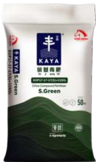
Kaya S.Green 佳雅硫基青肥 SOP17-17-17(S)+11SO 3