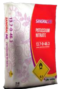
Sangraline Potassium Nitrate 13.7-0-46.3

*Terima kasih kerana mempertimbangkan Kuda Merah! Untuk sebarang pertanyaan produk, sila hubungi pengedar sah berdekatan anda untuk mendapatkan bantuan tentang aplikasi, dos dan frekuensinya.