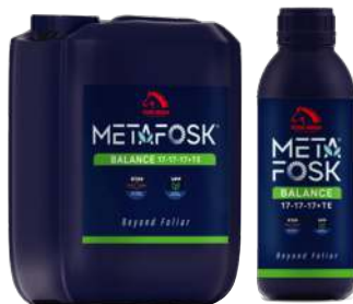
Metafosc Balance 元丰 Balance 17-17-17+TE