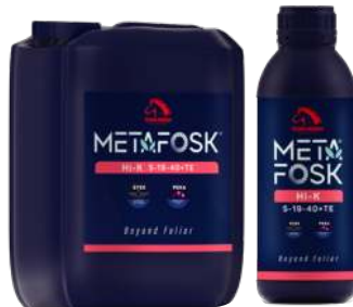
Metafosk Hi-K 元丰 Hi-K 5-19-40+TE