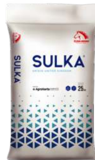
Sulka 0-0-14+6MgO+ 17CaO+48SO 3