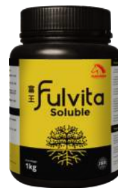
Fulvita Soluble 富王

*感谢您考虑Kuda Merah! 如有任何产品咨询，请联系您最近的授权经销商以获取有关产品应用程序、剂量和频率。