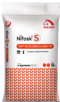
Nifosk S 豐王 S SOP15-5-20(S) +2MgO+25SO 3 +TE