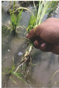
Tanpa Penggunaan WEGROW