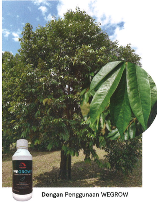
Dengan Penggunaan WEGROW

WEGROW 能促进细胞的原生质流动，提高细胞活力。能加快生长速度，打破休眠，促进生长发育，防止落花落果、裂果、缩果，改善产品品质，提高产量，提高作物的抗病、抗虫、抗旱、抗涝、抗寒、抗盐碱、抗倒伏等抗逆能力。