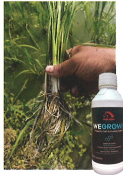
Dengan Penggunaan WEGROW