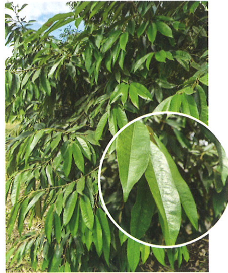
Tanpa Penggunaan Almino