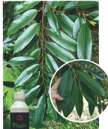
Dengan Penggunaan Almino